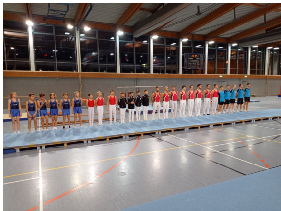
Schüler C, Turner